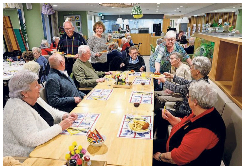
Gezamenlijk aan de patat met kroket of kaassoufflé.